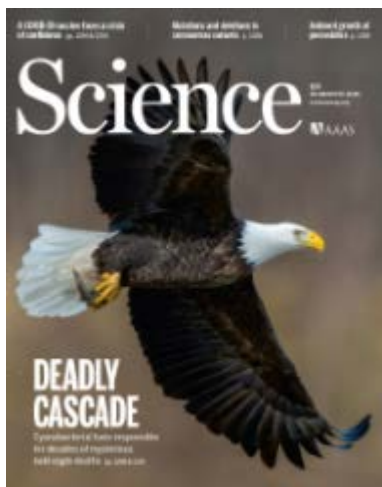
Obr. 1 – Titulní strana časopisu Science